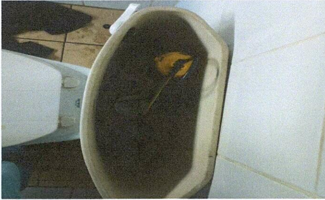
Foto1: MEJORAMIENTO DE ÁREA DE SERVICIOS SANITARIOS