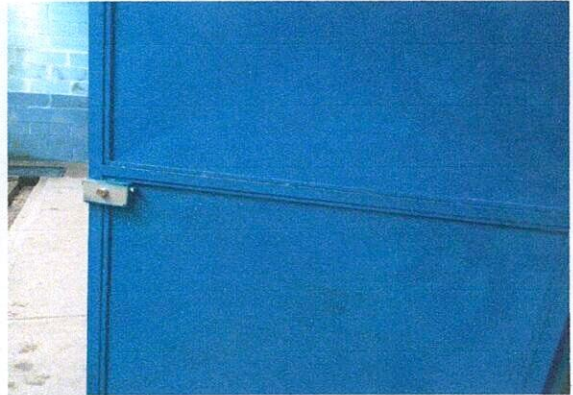
Foto 2: REPARACIÓN DE PUERTAS (Pintura, Reparación, Cambio de Chapaz)